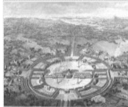
Zoutfabriek nabij Arc et Senans

In Engeland werd in de achttiende eeuw door de zeepfabrikant Lever in een nieuw dorp gebouwd (Port Sunlight) voor de werknemers in zijn fabriek, zoals ook de katoenfabrikant Owen deed met het dorp New Lanark in Schotland.