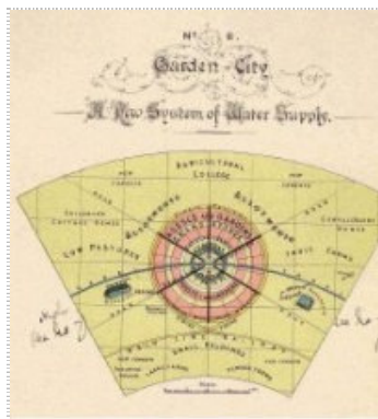
Plan van Howard's tuinstad

Inmiddels kwam er weer een nieuwe gedachte voor de nieuwe stad op. In Engeland werd in 1902 een boek over nieuwe stedenbouw gepubliceerd van de hand van Ebenezer Howard. Hij gaf zijn boek de titel "Garden Cities of Tomorrow", met de veelzeggende ondertitel "A Peaceful Path to Real Reform". Deze Howard voelde zich sterk aangesproken door de abominabel slechte woontoestanden die in Londen en andere grote steden in Engeland ( en op het continent!) waren ontstaan als direct gevolg van de snelle industrialisatie. Grote hoeveelheden mensen waren van het platteland vertrokken naar grote steden om daar in de nieuwe fabrieken te gaan werken. Maar er waren onvoldoende woningen en de woningen die er waren raakten overbevolkt en verkeerden in een verschrikkelijke conditie. Het leven in de Londense slums was een ware hel, met ziektes, geweld, vervuiling en lawaai als normale verschijnselen die een goed bestaan onmogelijk maakten.