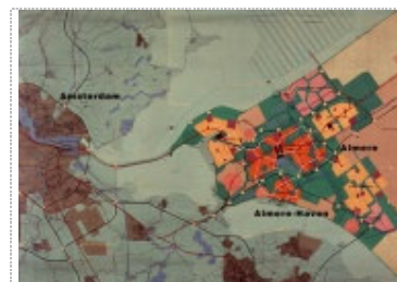
Plan Almere 1977 (T. Koolhaas associates)

Kenmerkend voor deze nieuwe steden is - naast de snelle planmatige en veelal door de overheid geleide groei - het modernistisch ontwerp van stad en gebouwen, en het gebruik van moderne technieken en materialen. Aan deze steden is bijna altijd scherp af te lezen in welke tijd en volgens welke stedenbouwkundige stroming zij zijn ontworpen en gebouwd. Veel van de wat vroegere steden dragen naar vormgeving het kenmerk van de traditionalistische opvatting (laagbouw, baksteen in een groene omlijsting), zoals in de vroege Engelse en Nederlandse tuinsteden- en dorpen. Maar later in de tijd - zestiger jaren - worden de nieuwe steden gebouwd volgens modernistische opvattingen, die teruggaan op de beginselen van een architect als Le Corbusier, die zelfs eens opperde het stadscentrum van Parijs door modernistische nieuwbouw te vervangen.