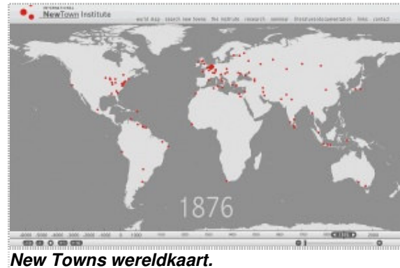
New Towns wereldkaart.

De inwoneraantallen van deze steden zijn zeer gevarieerd, uiteenlopend van aantallen onder de 50.000 tot uitschieters ver boven het miljoen. Een compleet overzicht van deze grote aantallen nieuwe steden op wereldschaal is tot op heden niet beschikbaar en zou ook buiten het kader van deze beknopte informatie vallen. De website van het New Town Institute bevat wel een goede interactieve wereldkaart met New Towns. De globale ontwikkelingen worden hieronder kort aangestipt.