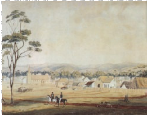
New Town Adelaide in 1839

en metropool uitgegroeide nederzettingen, in een betrekkelijk los verband en in heel lage woningdichtheden. Een nieuwe ontwikkeling hierin vormen steden die als particulier project worden ontworpen voor een kopersmarkt zonder veel stedelijke sfeer en voorzieningen, zoals die zijn te vinden in Amerika (Columbia-Maryland, Horizon City (Texas), Irvine Ranch (California), in Australië (Monarto en Murray New Town-Adelaide) en in Canada (Bramalea en Erin Mills bij Toronto). Het zijn overigens allen redelijk grote steden met een (voorzien) bevolkingsomvang van 100- 200.000 inwoners.