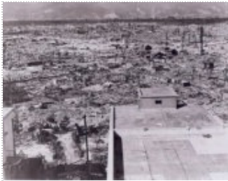
Hiroshima: vernield en herbouwd.