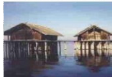
Paalwoningen in de Bodensee.

De bevolking in deze steden nam toe omdat de stad bescherming bood tegen de veelal nog woeste buitenwereld en omdat handel en nijverheid in de stad beter mogelijk was dan daarbuiten. De opbouw en ontwikkeling van deze steden nam vele decennia in beslag en soms ook vele eeuwen. Men kan dan ook bezwaarlijk spreken van nieuwe steden. Er wordt dan weliswaar voortdurend iets nieuws toegevoegd, maar de stad zelf is dan toch al min of meer oud te noemen. Het meest bijzonder aan het verschijnsel stad was dat het niet alleen woningen waren die het beeld bepaalden, maar ook een veelheid aan andere gebouwen ten behoeve van de stedelijke voorzieningen, zoals molens, kerken, scholen, winkels, bedrijven, ziekenhuizen, kazernes en zo meer. De groeiende welvaart ging gepaard met het ontstaan van een grote verscheidenheid aan beroepen en bedrijven, en universiteiten die als kenniscentra voor de zich ontwikkelende samenlevingen gingen functioneren. Sommige van de oude nederzettingen ontwikkelden zich in het geheel niet tot stad en bleven klein en dorps. Anderen echter werden grotere steden en sommigen daaronder werden ware metropolen: wereldsteden.